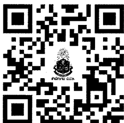
สแกนเพื่อลงทะเบียน

ขั้นตอนที่ 1 สแกน QR Code ด้านล่างนี้ เพื่อเข้าสู่ระบบการลงทะเบียน