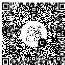
สแกนเพื่อ LINE Open Chat ศูนย์แก้ไขปัญหาการลงทะเบียนฯ