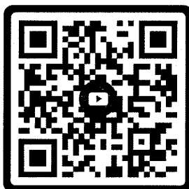
สแกนเพื่อเข้าร่วมสัมมนาฯ